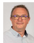
Direction Jean-Philippe Binos