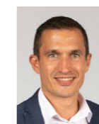
Direction Alexandre Blois