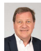
Direction Frédéric Bettini