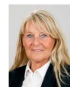
Direction Pascale Mignot